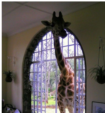
כשהטבע והאדם נפגשים

בחודש אחד נחגגו הימים והחגים המכוננים ביותר של עמנו – היציאה מעבדות לחירות , (כשמושג זה עצמו נתון להגדרות משתנות), המעבר משלטון זר - לעצמאות!!! (לא קלה היא, לא קלה, דרכנו...).