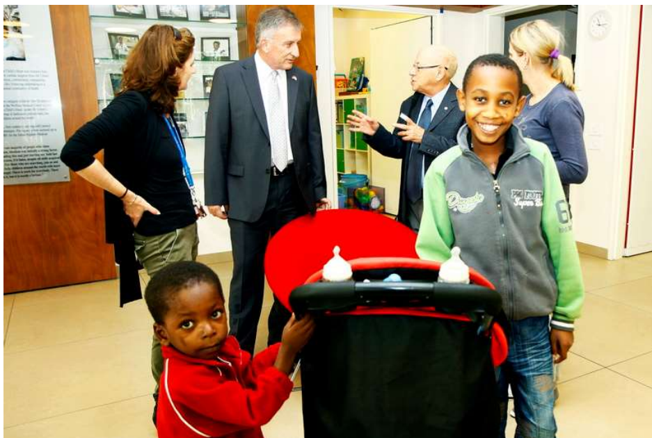
ילד ובני משפחתו שהגיעו לבית החולים. ברקע שגריר סרביה וחנן