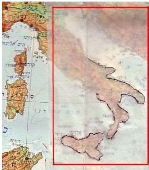
ככה זה שמעתיקים מפה עם נייר פרגמנט ונפט

בהתקרב פתיחת שנת הלימודים וחזרתם של למעלה משני מיליון (!!!) תלמידים בכל הגילאים, (כולל נכדתי שנכנסת לכיתה א') ובכל יישובי הארץ למערך הלימודים, וזאת למרות הקיץ הבלתי-אפשרי שעברנו כולנו. ועתה כיף גם להיזכר בכמה תמונות מאז שאנחנו היינו תלמידים בבית הספר.