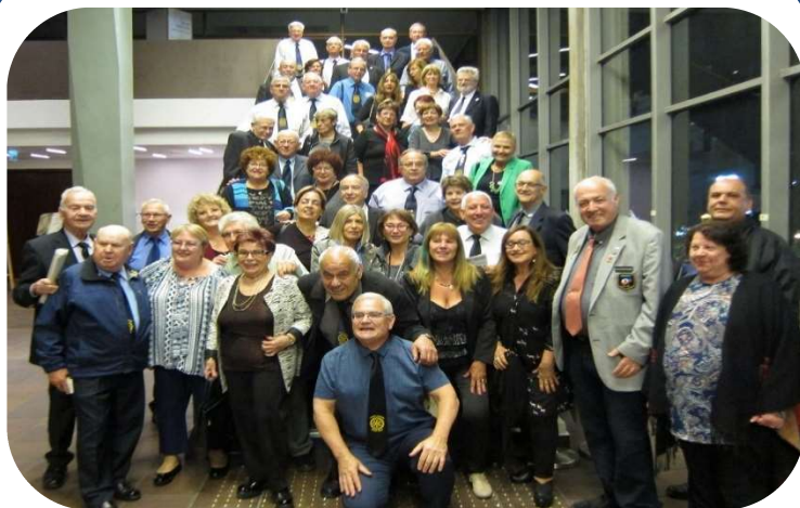
חברי המועדון בצרפת התראה אההיאה

זונדל שכטר היה מבין 12 המשפחות הראשונות בכפר סבא ב- .1910