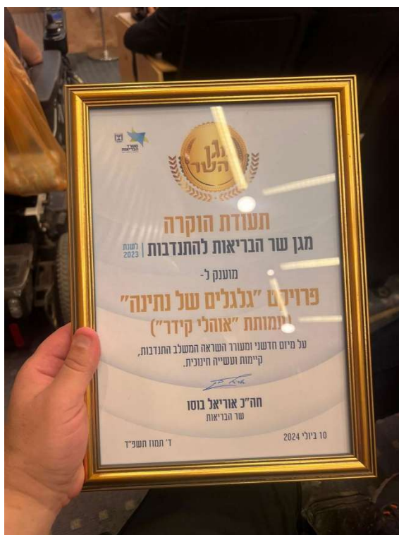
מועדון רוטרי כפר סבא תומך בגלגלים של נתינה