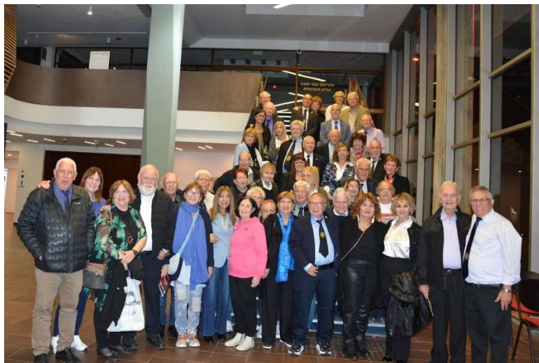
. חברי המועדון בצרפת התכנסו לקהילה - 2026