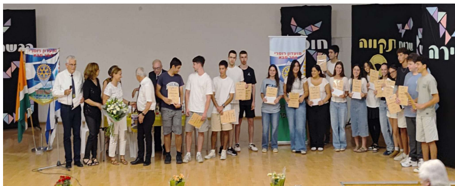
מקבלי הפרסים בטכס 2025