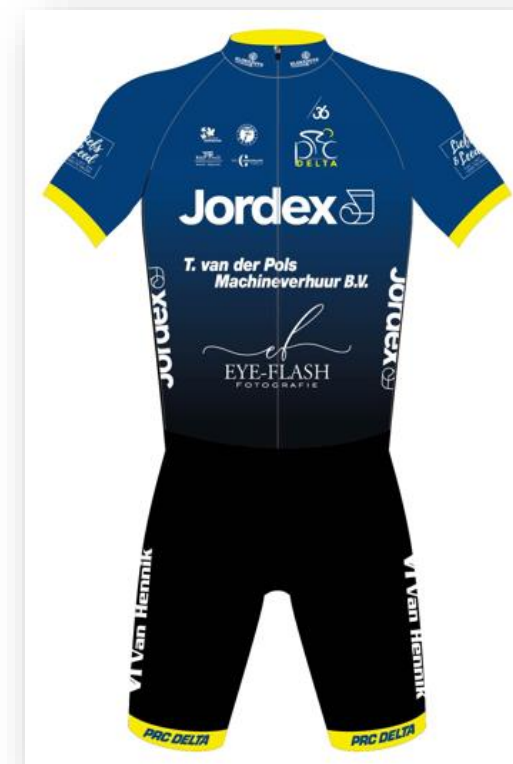
Nieuw tenue 2023-2025