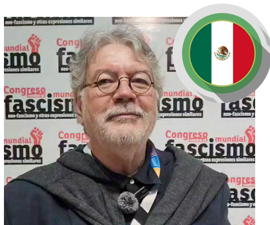
Fernando Buen Abad, filósofo mexicano

Hay una revolución de la conciencia que se está verificando aquí ahora, hay un llamado muy importante del pueblo de Venezuela a que revisemos el salto retrógrado enorme que representa el nazi-fascismo y la oportunidad que tenemos de organizar una gran internacional antifascista.