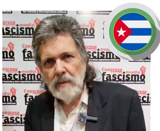
Abel Prieto, intelectual cubano

El nuevo fascismo está creciendo en Europa, en Estados Unidos y lo tenemos en Nuestra América lamentablemente. En la gran conspiración para tratar de arrebatarle la victoria del 28 de julio al pueblo bolivariano está metido este nuevo fascismo de lleno, mintiendo, usando las redes sociales, la manipulación de la información y de las emociones.