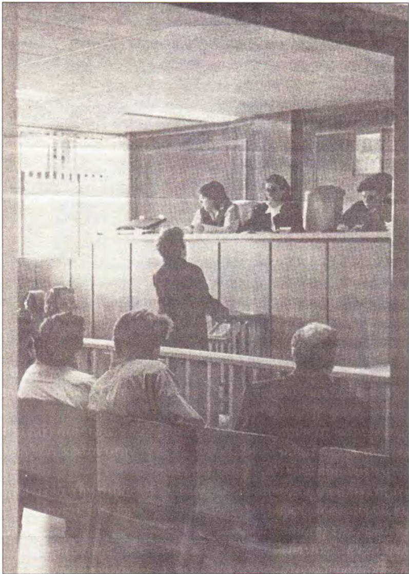
Ἡ γυναικοκρατία στὰ δικαστήρια