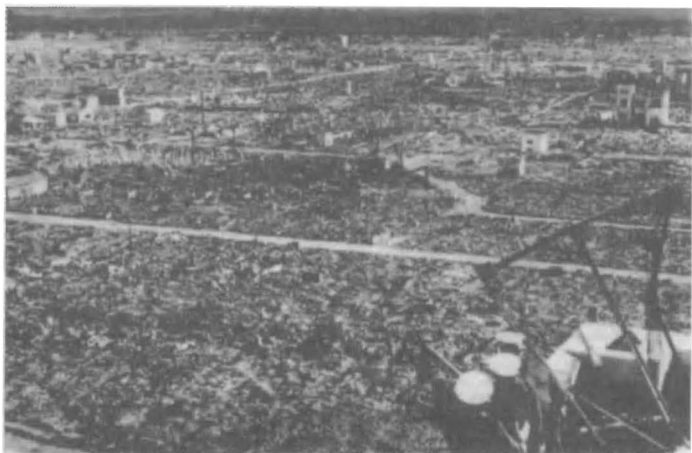
Χιροσίμα 6 Αυγούστου 1945