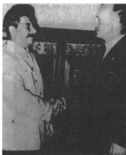
Στάλιν και Ρίμπεντροπ.

Γερμανοί και Ρώσοι Αξιωματικοί μετά την κατάκτησιν και διανομήν της Πολωνίας μεταξύ Γερμανίας και Ρωσίας. Κατόπιν οι σοβιετικοί «εδίκαζαν» τους Ναζί, διά την επίθεσιν κατά της Πολωνίας.