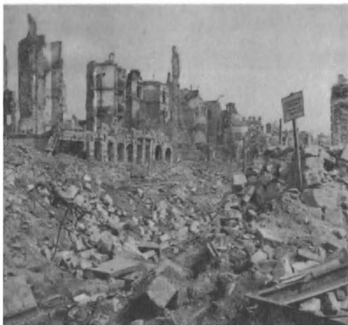
Τα ερείπια της Δρέσδης

Φεβρουάριον ισοπέδωσαν και κατέκαυσαν την Δρέσδη, πόλιν με ανεκτιμητους αρχιτεκτονικούς και καλλιτεχνικούς θησαυρούς.