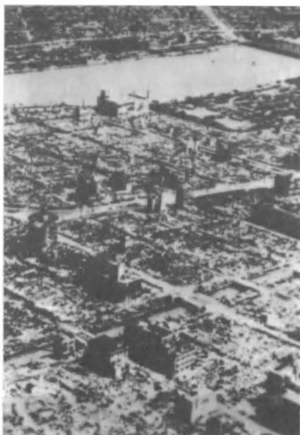
Τόκιο 10 Μαρτίου 1945