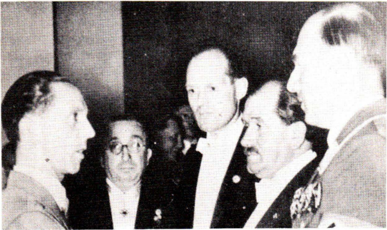
Ό Γκαϊμπελς συνομιλεί με τούς διασήμους έφευρέτας μηχανικούς Χάινκελ, Μέσσερσμιτ και Πόρσε. Δεξιά ό Υπουργός Τόντ.