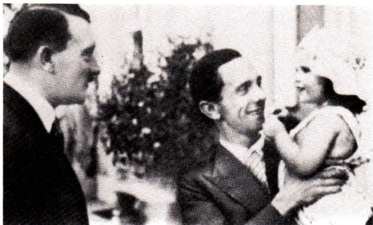
Ό Χίτλερ και ό Γκαϊμπελς με μία κόρη του.