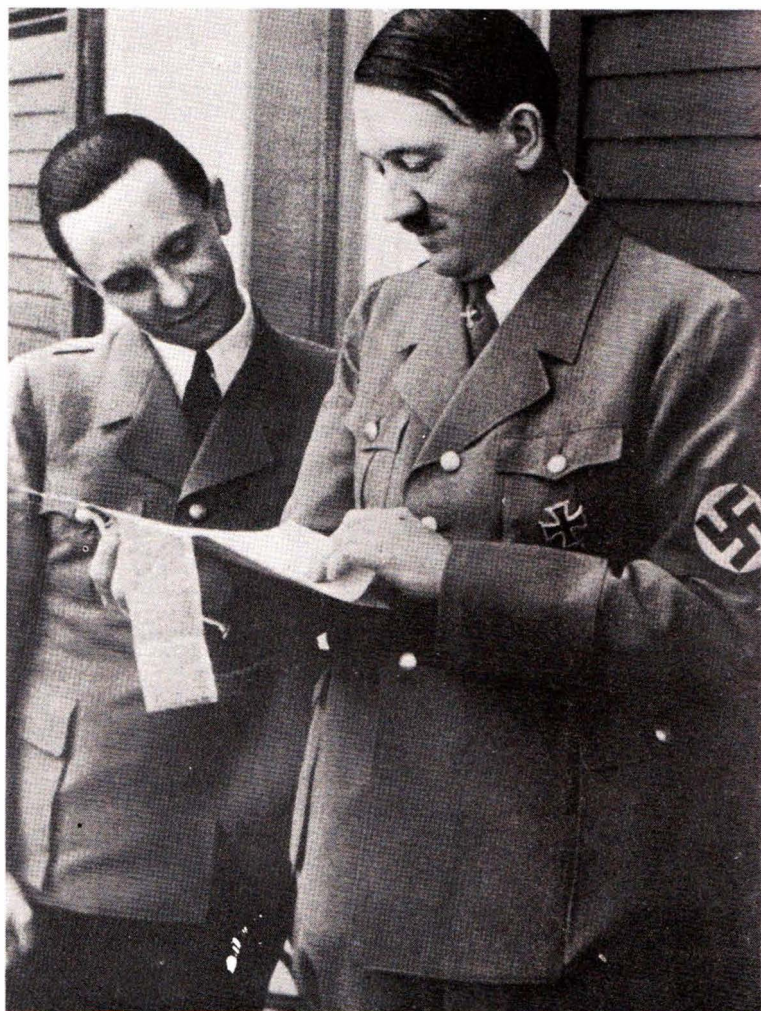
Ὁ Γκαϊμπελς μετὸν Χίτλερ.