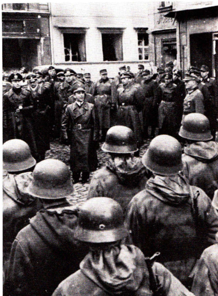
1945: Ο Γκαϊμπελς όμιλεί προς τούς υπερασπιστάς του Λάουμπαν.