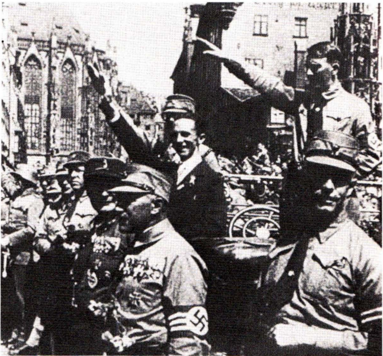
1927: Ο Γκαϊμπελς παρακολουθεί παρέλασι τῶν «Ταγμάτων Ἐφόδου» (S.A.) στήν Νυρεμβέργη.