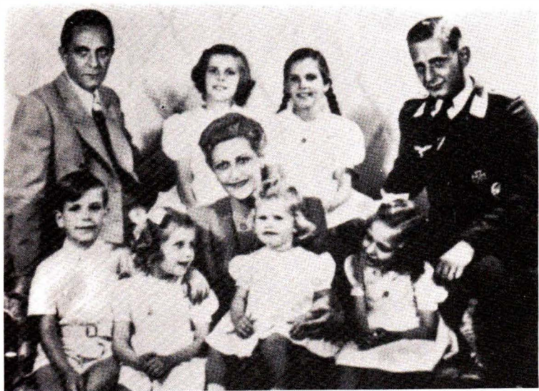
Ό οικογένεια Γκαϊμπελς. Ό Άξιωματικός είναι γιός της συζύγου του Γκαϊμπελς από τόν πρώτο της γάμο.