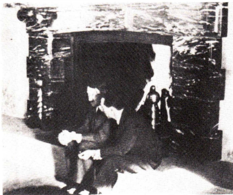
Στό Μπέργκχοφ. Ό Γκαϊμπελς συνομιλεί με τόν Χίτλερ, δίπλα στό τζάκι.