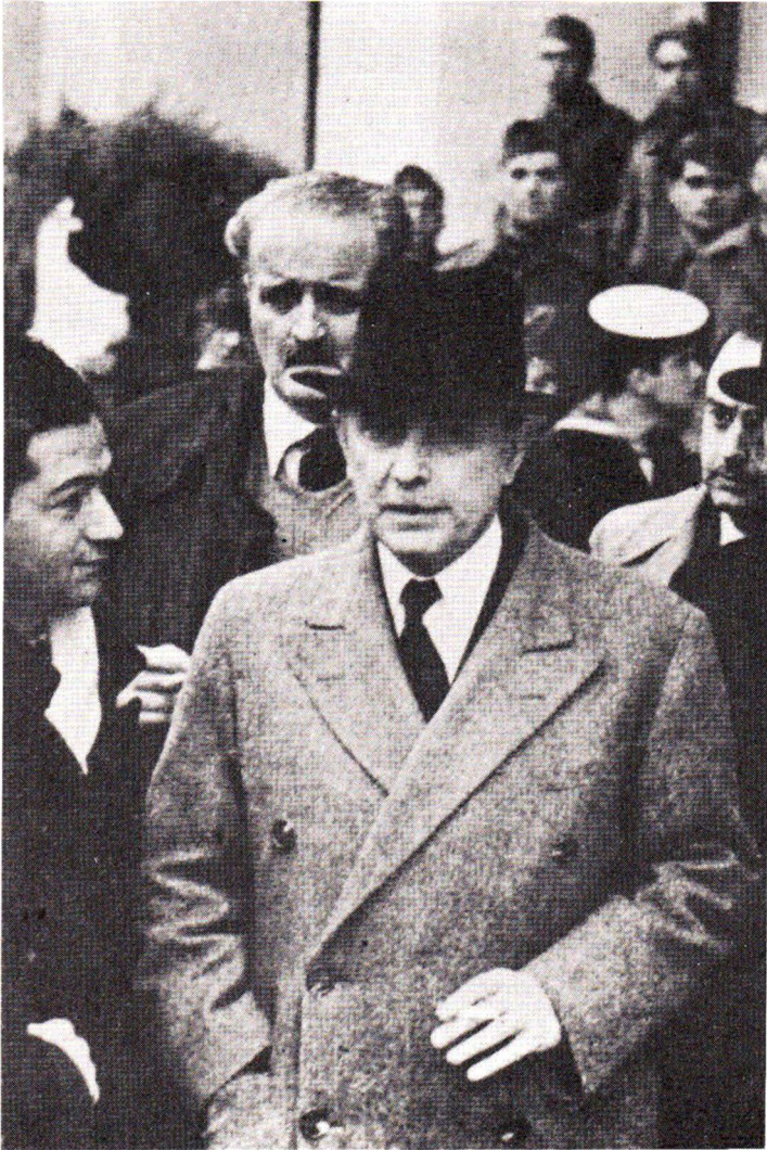
Ὁ ἥρωϊκὸς πρωθυπουργὸς Α. Κοριζῆς. Ὅπισθὲν τοῦ ὁ Κ. Κοτζιάς, εἰς πραγματικῶς-κρίσιμους στιγμὰς.