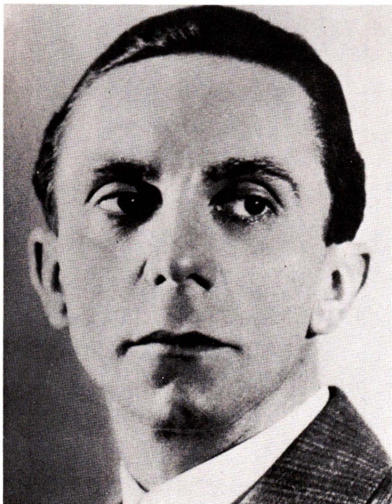
Δρ. Γιόζεφ Γκαϊμπελς