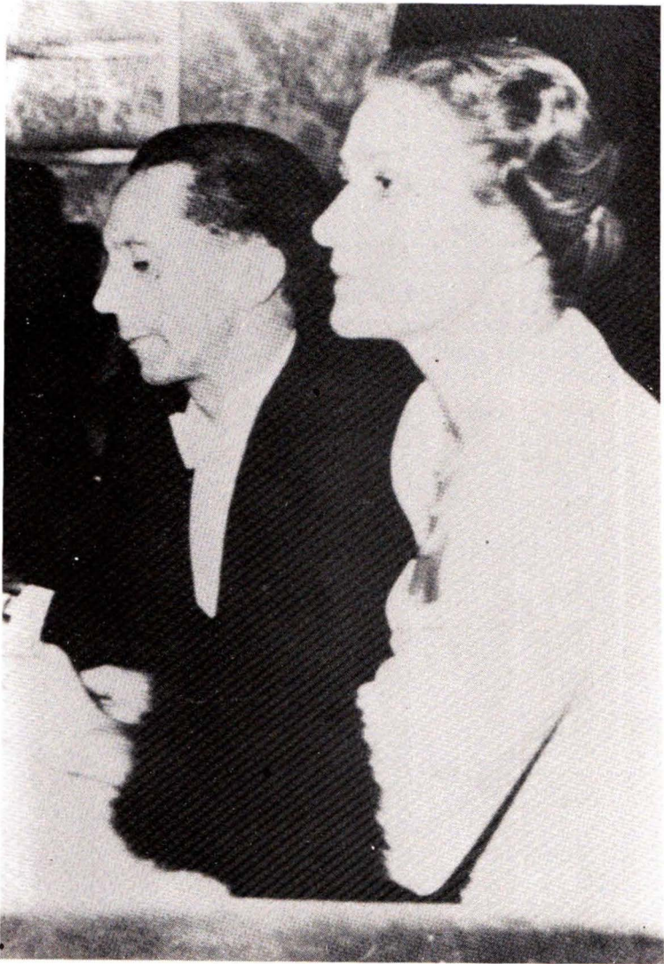
1939: Ό Γκαίμπελς με την σύζυγό του Μάγδα.