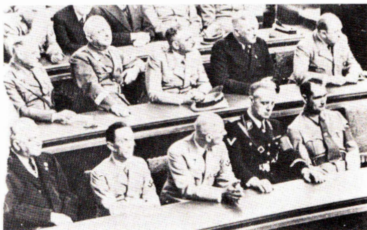
Άπο πολιτική εκδήλωσι στην «Όπερα Κρόλλ». Στην πρώτη σειρά, ό φόν Νώϋρατ, ό Γκαϊμπελς, ό Φρίκ, ό φόν Ρίμπεντροπ και ό φόν Ές.