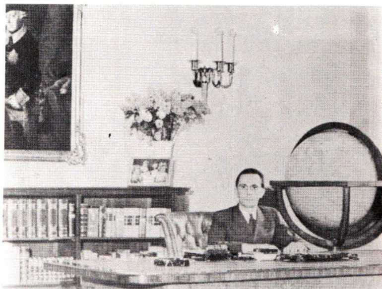
Ό Γκαϊμπελς στο γραφείο του, στο ύπουργείο προπαγάνδας.