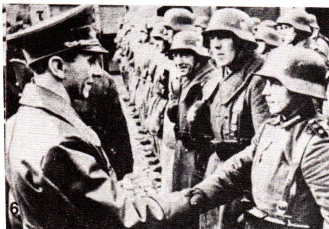
1945: Ο Γκαϊμπελς συγχαίρει νεαρό πολεμιστή.