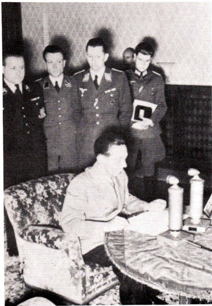
22 Ίουνίου 1941: Ή Γκαϊμπελς αναγγέλει στόν Γερμανικό λαό, από ραδιοφώνου, τήν Γερμανική επίθεση κατά τής Ρωσίας.