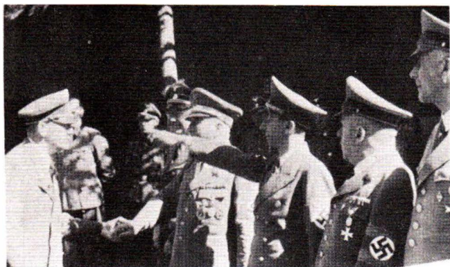
1944: Μετά την άποτυχημένη απόπειρα δολοφονίας του Χίτλερ. Ο Γκαϊμπελς χαιρετά.