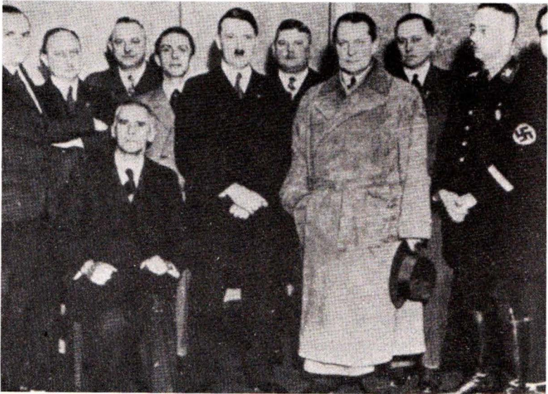
1933: Ἡ πρώτη ἔθνικοσοσιαλιστικὴ κυβέρνησις τῆς Γερμανίας. Ὁ Χίτλερ περιστοιχίζεται ἀπὸ τοὺς Γκαϊμπελς, Ραϊμ, Γκαϊρινγκ, Χίμλερ. Μόλις διακρίνεται δεξιὰ ὁ Φόν Ές.