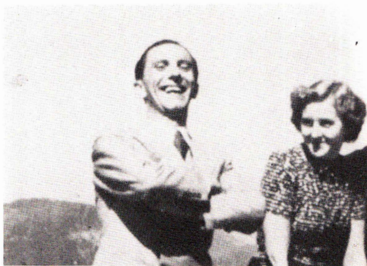
Γκαϊμπελς και Εύα Μπράουν.