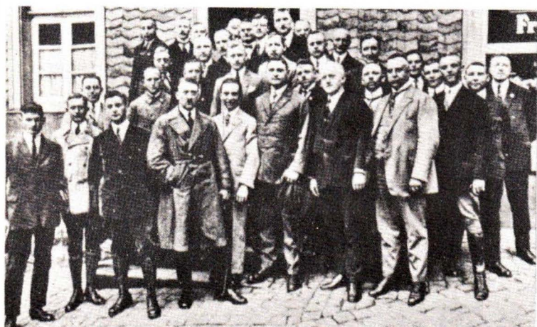
1926: Χίτλερ και Γκαϊμπελς μέσω στελεχών τοῦ ἔθνικοσοσιαλιστικοῦ κόμματος.