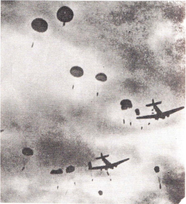
Οί' Αλεξιπτωτισταί τοῦ Φόν Στουτέντ πίπτουν εἰς τήν Κρήτην.