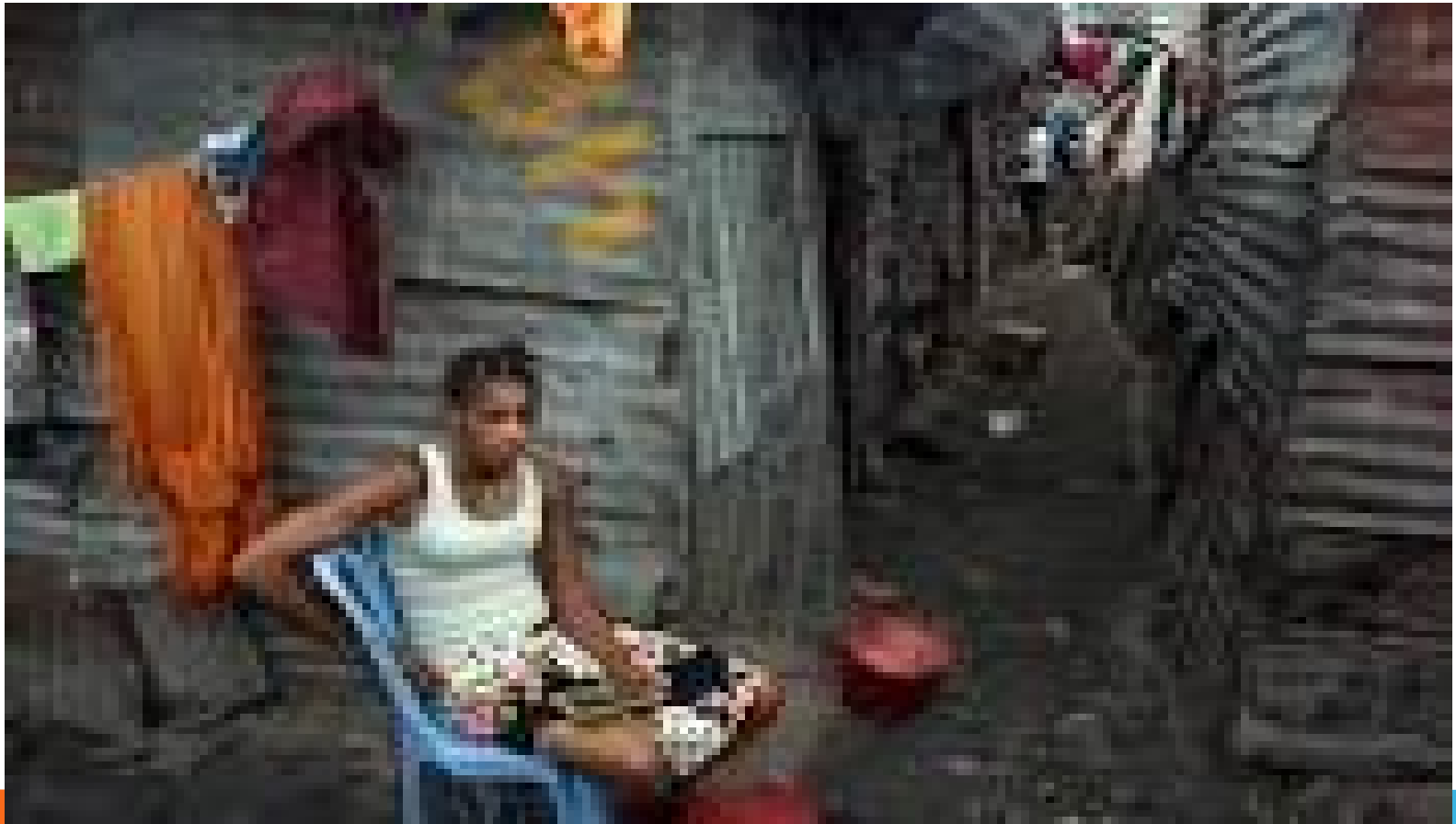
Une jeune femme au quartier Mange NGENGE, n'sele, Kinshasa/RDC