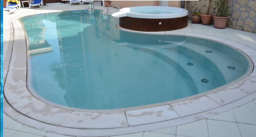
Hotel Bellerofonte - Rimini