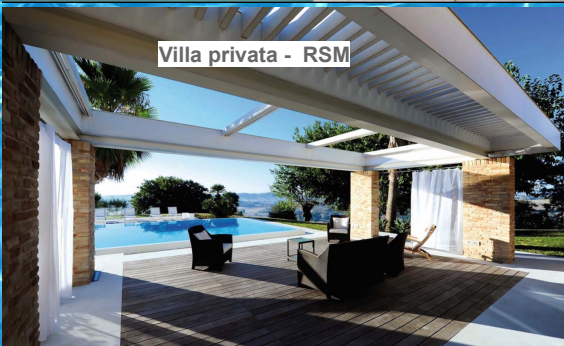
Villa privata - RSM