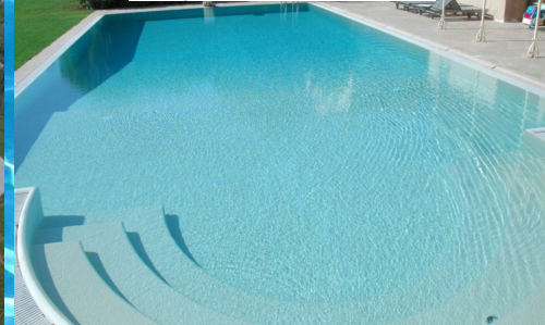
Villa privata - Monte Conero