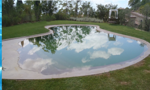
Residenza privata - Crete Senesi SI