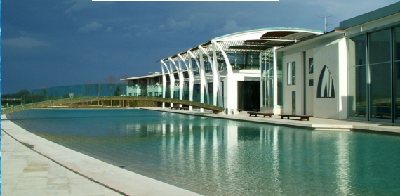
Riviera Golf - Cattolica RN