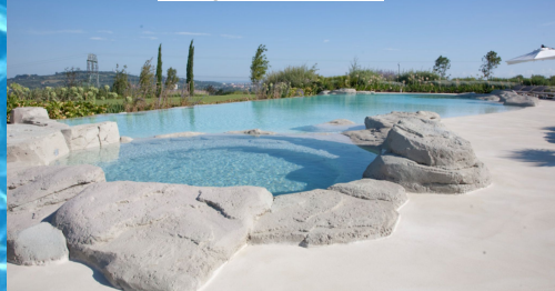
Villa privata - Rimini