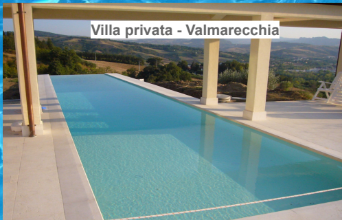
Villa privata - Valmarecchia