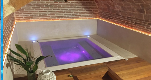
Centro benessere - Jesi