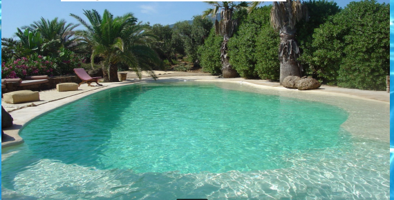
Villa privata - Isola di Pantelleria