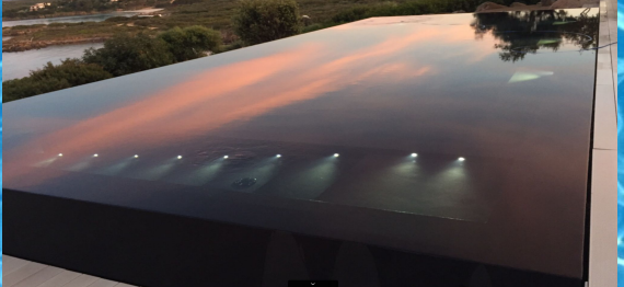
Piscina nera - Porto Cervo