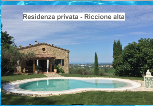
Residenza privata - Riccione alta