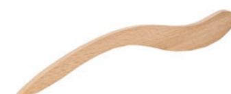
Espátulas de acabamento de 15 mm de largura SI-590-0015-400