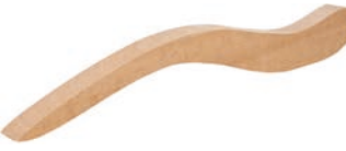
Braçadeira de cola 15 cm SI-590-6000-150