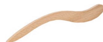
Espátulas de acabamento de 8 mm de largura SI-590-0008-400