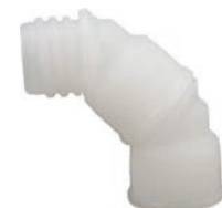
Bico multidoseador (8 l) SI-590-0000-455