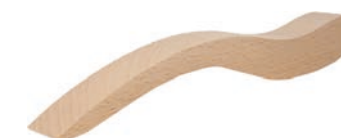
Espátulas de acabamento de 35 mm de largura SI-590-0035-400