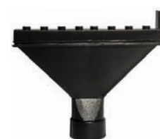
Bico misturador 750 Poxifix SI-590-0530-000