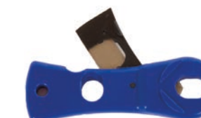
Espátulas de acabamento de 10 mm de largura SI-590-0010-400