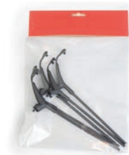
Bico de tubo longo SI-590-0000-100