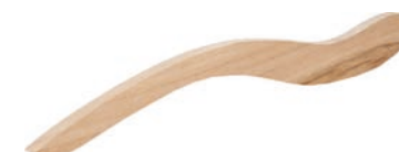
Espátulas de acabamento de 20 mm de largura SI-590-0020-400