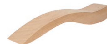
Conjunto de espátulas de acabamento de 6/8/10/15/20/25/30/35/40 mm SI-590-0100-400