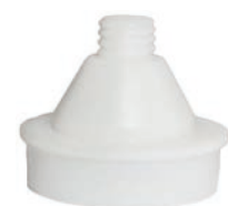
Bico longo para cartucho SI-590-0000-200