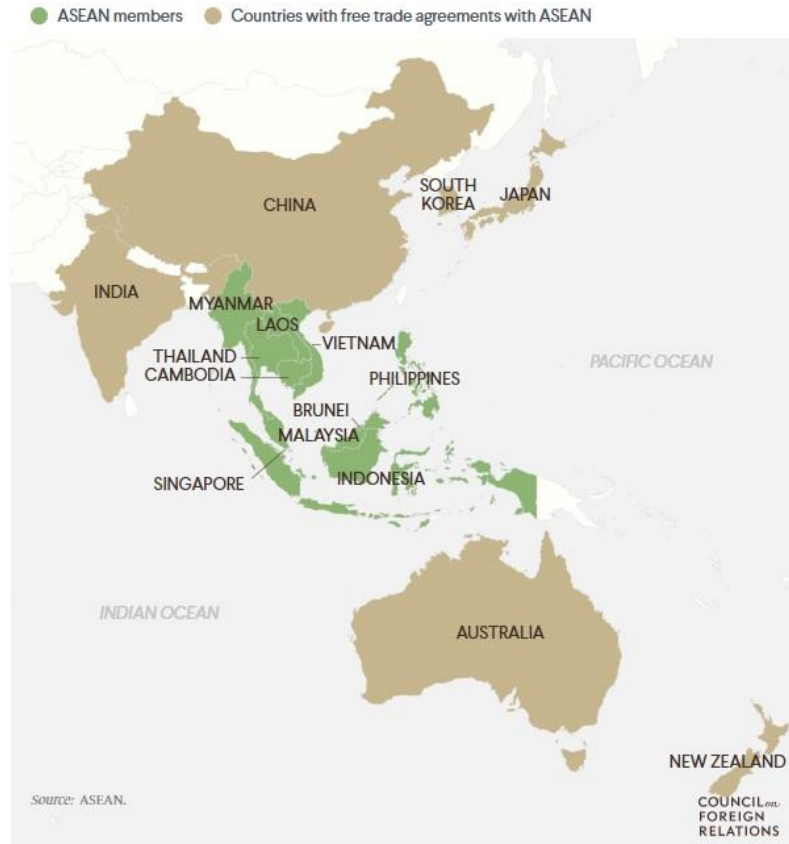
Şekil 1. ASEAN üye ülkeleri 8

müteşekkildir. 6 II. Dünya Savaşı sonrasında dünya üzerinde ABD liderliğinde kurulmuş olan Batı hegemonyasına karşı mücadele için teşkil edilen Bağlantısızlar Hareketi 7 de Filipinler Cumhuriyeti'nin üye olduğu önemli bir uluslararası organizasyondur. Bütün bu süreçler göstermektedir ki Güneydoğu Asya coğrafyasının önemli ülkelerinden birisi olan Filipinler Cumhuriyeti, uluslararası iş birliği için çalışan ve yine uluslararası hukuka uygun şekilde bu iş birliğini geliştirmek için adımlar atan bir aktör konumunu sürdürmektedir.